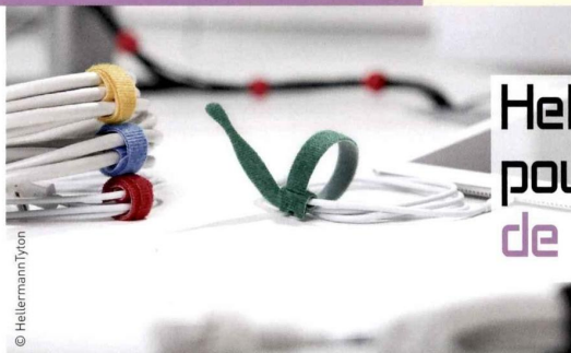
Les colliers Textie auto-agrippants existent dans de multiples couleurs et longueurs.